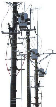
Rozłączniki THO-24 na słupach