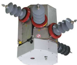
Rozłącznik THO z przekładnikiem PR-0,72